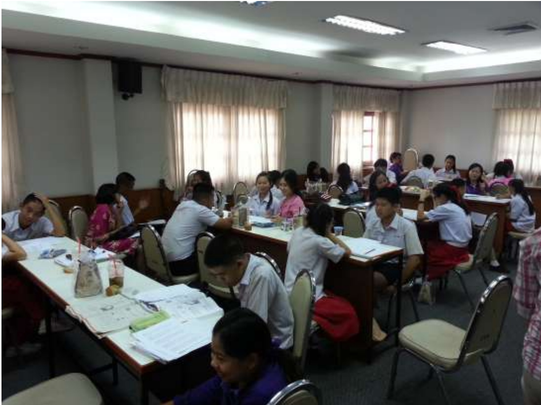
คณาจารย์และนักเรียนโรงเรียนเชียงรายวิทยาคมสัมผัสประสบการณ์วิธีการถ่ายถอดแบบทิวทอเรีย