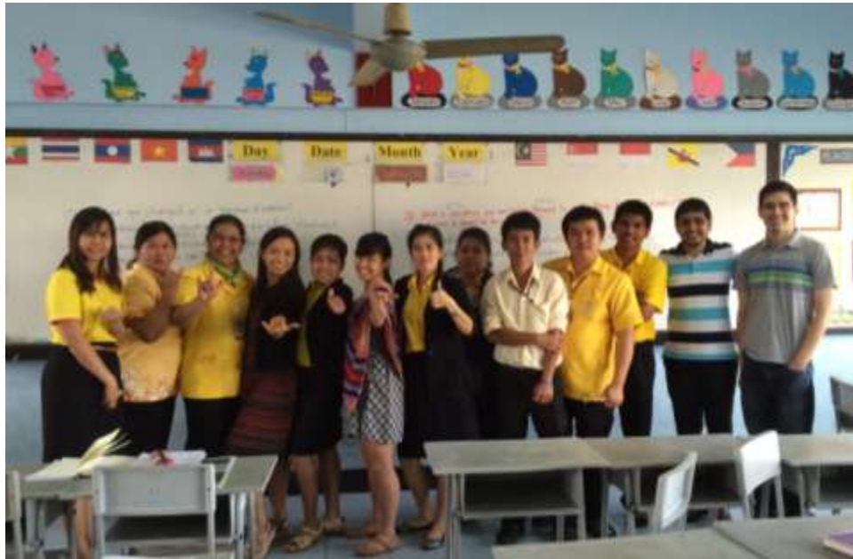
คณะครูโรงเรียนผดุงราชบุรี หลังจากการศึกษาเนื้อหาบทเรียนร่วมกับทีมฟิฟตี้โฟลด์ เมื่อเดือนธันวาคม 2014

“นักเรียนในกลุ่มนักเรียนอ่อนมีความกระตือรือร้นมากขึ้น และสนใจบทเรียนมากขึ้นเมื่อได้เรียนกับเพื่อน (มีเพื่อนเป็นคนตัวให้) และมีกระบวนการคิดวิเคราะห์เพิ่มขึ้น เกิดการช่วยกันเรียนระหว่างตัวเตอร์และตัวดี”