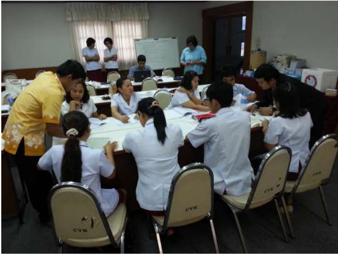
คณาจารย์โรงเรียนผดุงราชกุลให้การฝึกอบรมและสนับสนุน ณ โรงเรียนเชียงรายวิทยาคม