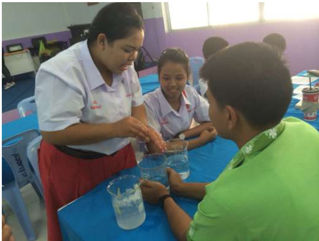
ค่ายทิวทองเรียที่โรงเรียนผดุงราชกุลร์ เดือนพฤษภาคม 2014 กับเต็มมาวิชาฟิสิกส์