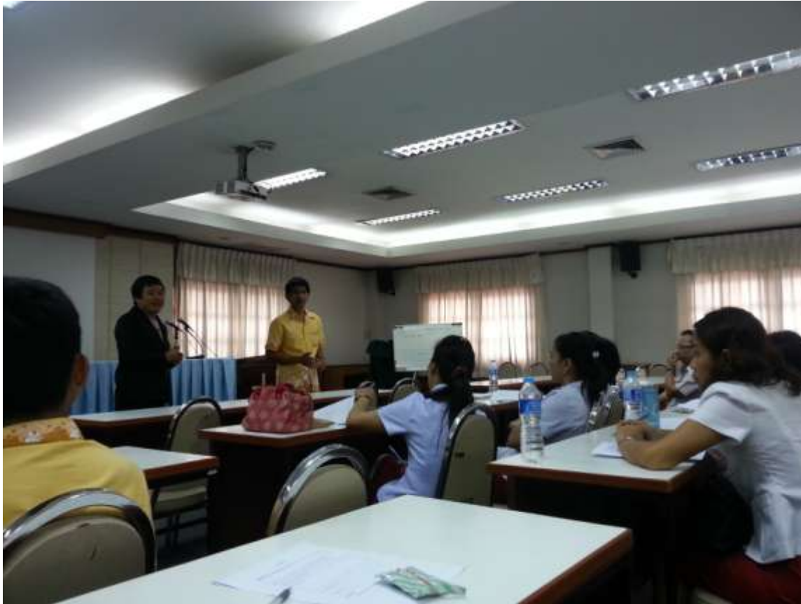
คณะครูจากโรงเรียนผดุงราษฎร์แบ่งปันประสบการณ์ทิวทอเรีย ณ โรงเรียนเชียงรายวิทยาคม เมื่อเดือนสิงหาคม 2014

สำหรับการแลกเปลี่ยนทางวิชาการในครั้งที่สองนั้น เมื่อคณะครูโรงเรียนเชียงรายวิทยาคมที่กลับไปยังจังหวัด เชียงรายก็มีความรู้สึกตื่นเต้นว่าทิวทอเรียจะได้ผลหรือไม่กับนักเรียนในโรงเรียนของตน จึงได้เริ่มต้นโครงการทิว ทอเรีย ด้วยความช่วยเหลือจากคณะครูจากโรงเรียนผดุงราษฎร์ พร้อมด้วยกับทีมพีพีดีโฟลด์ในโครงการค่ายอบรม ทิวทอเรียที่โรงเรียนเชียงรายวิทยาคม ค่ายทิวทอเรียในครั้งนั้นใช้เวลาทั้งหมด 5 วันตั้งแต่วันที่ 4 สิงหาคม ถึงวันที่ 8 สิงหาคม 2014 คณะครูจากโรงเรียนผดุงราษฎร์ได้เข้าร่วมค่ายกับพวกเราในวันที่ 4 สิงหาคม เพื่อฝึกครูระดับ มัธยมศึกษาโรงเรียนเชียงรายวิทยาคมซึ่งมาจากทุกสาขาวิชา