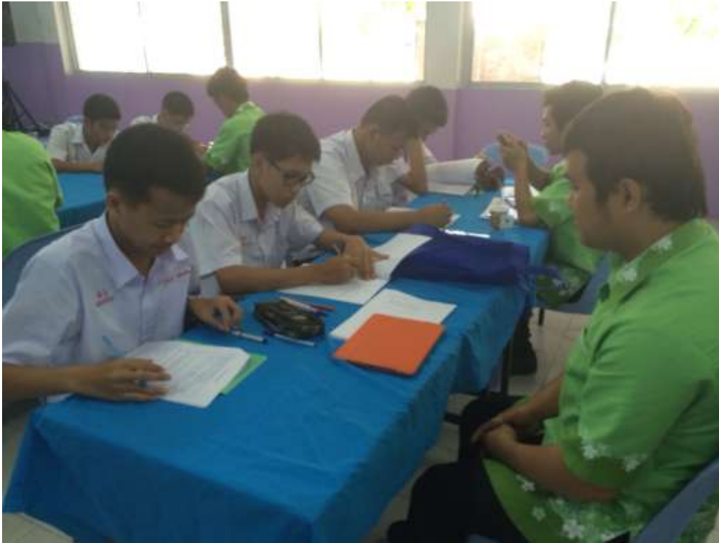
ค่ายทิวทองเรียที่โรงเรียนผดุงราชกุลร์ เดือนพฤษภาคม 2014