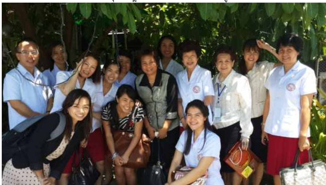
คณะครูจากโรงเรียนเชียงรายวิทยาคม ณ จังหวัดพิษณุโลก เดือนพฤษภาคม 2014

ในการอบรมครั้งนั้นครูและคณะผู้นำครูจากโรงเรียนเชียงรายวิทยาคมได้รับการติวจากนักเรียนระดับชั้นประถมศึกษาปีที่ 5 จากโรงเรียนผดุงราชบุรี โดยการแลกเปลี่ยนความรู้ทางวิชาการในครั้งนี้ใช้เวลา 1 วัน