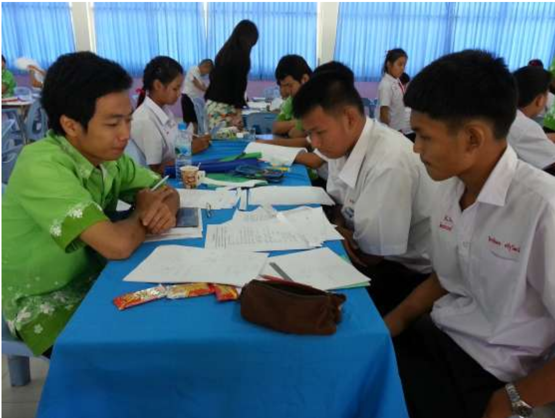
ค่ายทิวทองเรียวที่โรงเรียนผดุงราชบุรี เดือนพฤษภาคม 2014 ที่ใช้เติมมาวิชาคณิตศาสตร์ (ภาพบน) และวิชาภาษาอังกฤษ (ภาพล่าง)