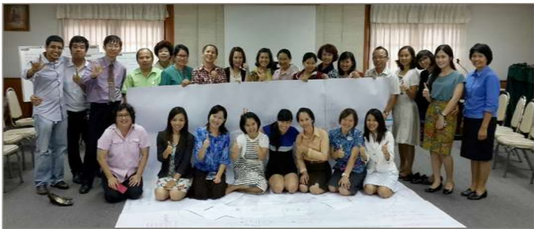
คณะครูโรงเรียนเชียงรายวิทยาคมในการประชุมกำหนดวิสัยทัศน์ร่วมกับทีมจีพีดีโพลด์ เมื่อเดือนสิงหาคม 2014